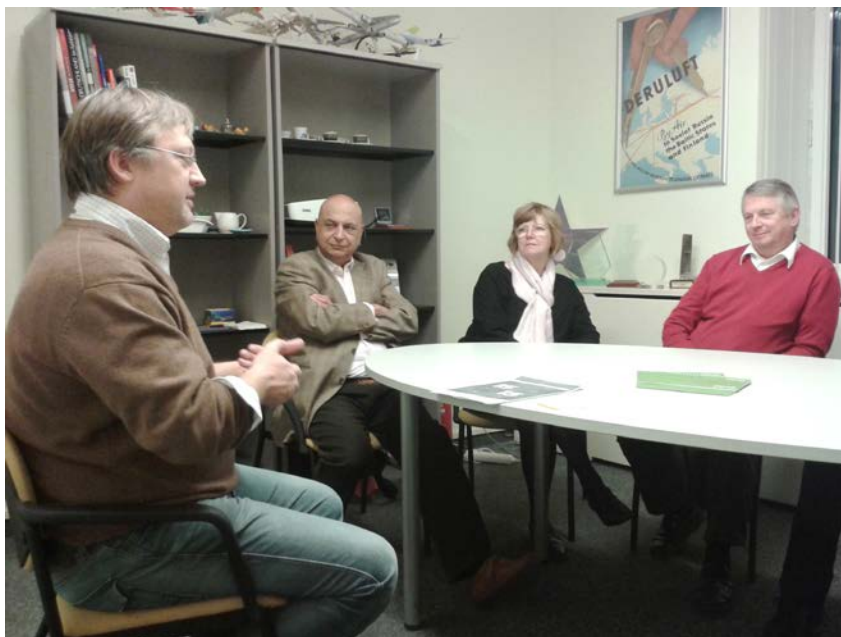
Vizita la cel mai bun exemplu de practica RSC, compania turistica din Riga, Carson Wagonlit Latvia

si de a intelege Pachetele de Lucru si Rezultatele Livrabile care trebuie completate pana la datele stabilite. Fiecarui partener de proiect i-au fost stabilite rolul si responsabilitatile specifice ce trebuie livrate inainte de urmatoarea reuniune.