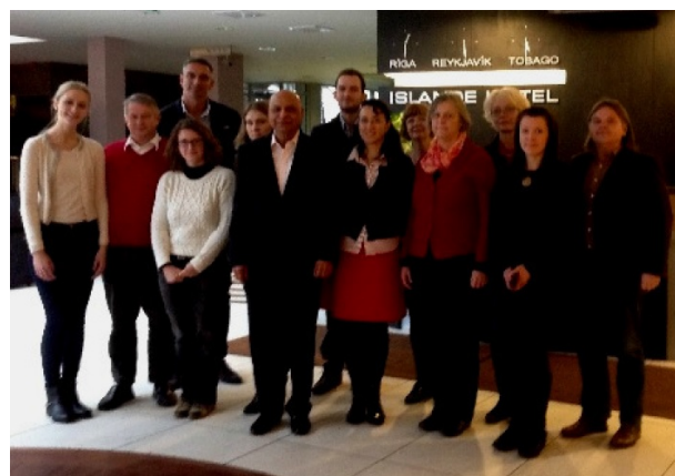
Les partenaires du projet Fair Tourism

C'est précisément l'objet de ce projet qui dure deux ans (du 1er septembre 2014 au 31 août 2016) de s'y intéresser.