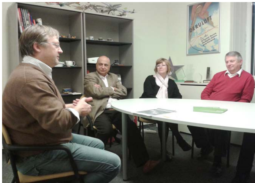
Echanges autour d'un exemple de bonnes pratiques en matière de RSE avec l'agence de voyage Carson Wagonlit de Riga, Lettonie

et de comprendre l'organisation des jalons, les résultats à atteindre ainsi que l'échéancier de travail. Chaque partenaire du projet s'est vu attribuer des rôles et responsabilités spécifiques dont il doit s'acquitter pour la réunion suivante.